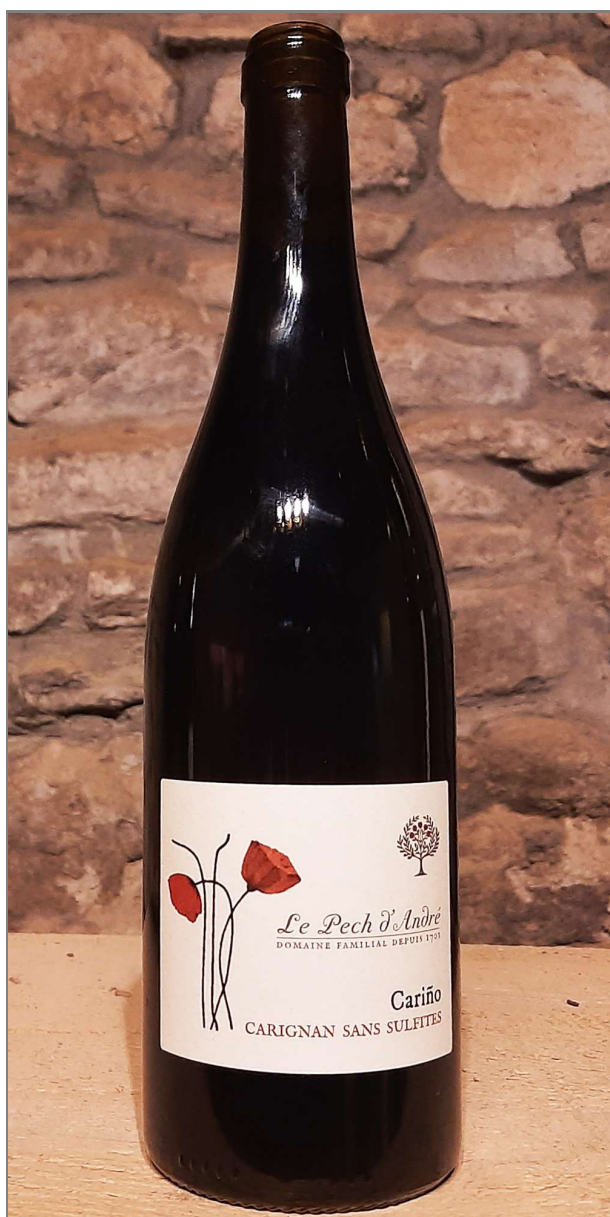
Photo et étiquette / Photo and label